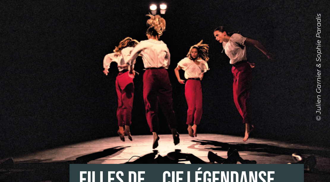
© Julien Garnier & Sophie Paradis