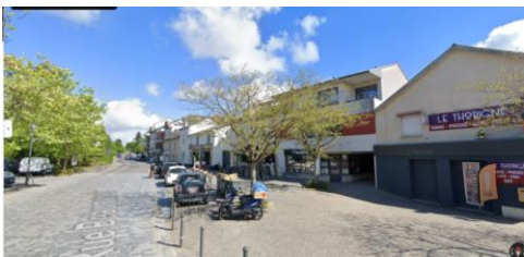
Situation géographique du commerce